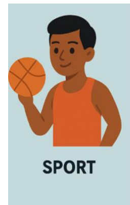
Fr. Thiemer Sporthalle