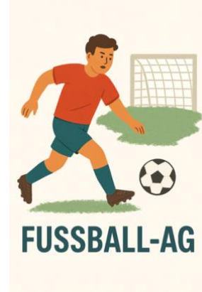
Hr. Peter Sporthalle