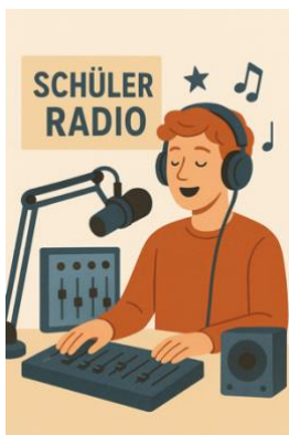
Hr. Schmidt nach Vereinbarung